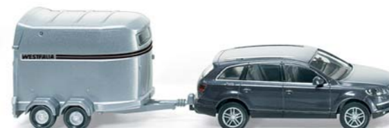
066 03 41 Audi Q7 mit Pferdeanhänger