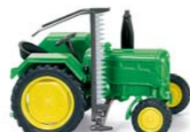
882 01 25 John Deere 2016