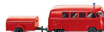
861 13 29 Feuerwehr – VW T1 mit Anhänger