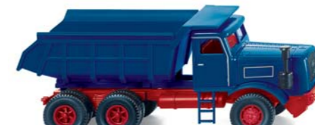
866 38 33 Muldenkipper (Kaelble)