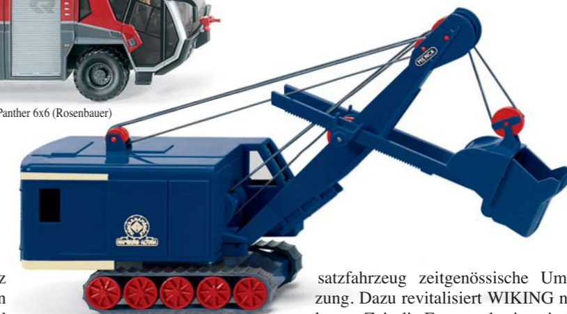
897 03 37 Menck-Bagger

Die Berliner Flughäfen sind stolz auf ihre neue Generation von Flugfeldlöschfahrzeugen – und WIKING miniaturisiert als Pendant dazu den Rosenbauer Panther 6x6 in 1:87. Die Modellpflege nimmt sich im April der Farbaktualisierung zahlreicher topaktueller Pkw von VW bis Mercedes an. Im Mittelpunkt steht zweifellos das imposante Gespann des Audi Q7 mit Pferdeanhänger. Zugleich