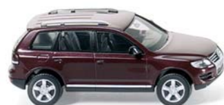
060 40 30 VW Touareg