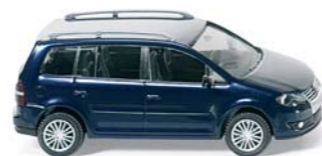
305 40 30 VW Touran