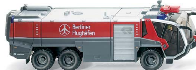
626 02 46 Feuerwehr – FLF Panther 6x6 (Rosenbauer)