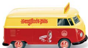
797 02 31 VW T1 mit Dachschild