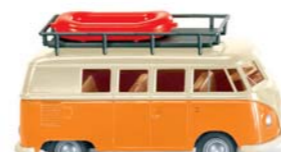
797 38 28 VW T1 mit Schlauchboot