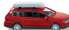
065 03 33 VW Passat Variant mit Dachbox