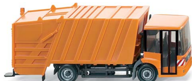
638 03 34 Pressmüllwagen (MB Econic Facelift)