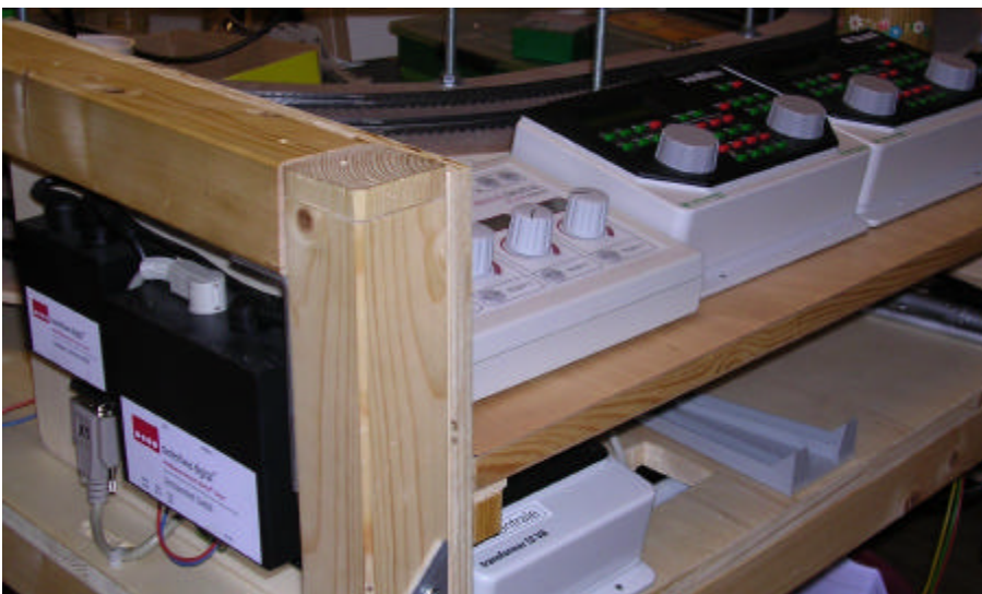
Meine „Zentrale“ - siehe auch Titelbild

Rautenhaus SLX 808 Funktions- (Schalt-) Decoder